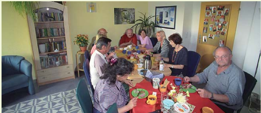
BewohnerInnen beim gemeinsamen Abendbrot

Wir haben die Erfahrung gemacht, dass ein bestimmtes kontrolliertes Trinken möglich ist und die Teilnahme am gesellschaftlichen Leben dadurch gesichert wird. In Krisensituationen sind die Mitarbeiter-