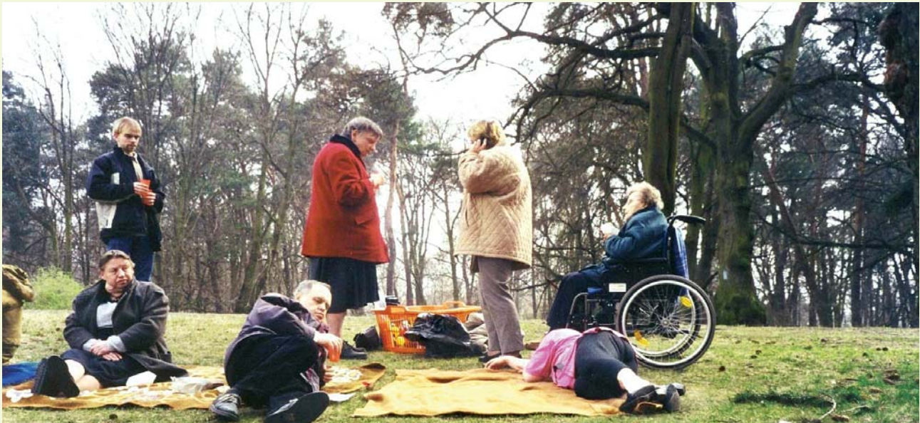
Picknick in der Wuhlheide

Auch überprüfen wir unsere Arbeitsabläufe und Arbeitsweise regelmäßig und entwickeln sie bei Bedarf weiter. Die in unserer Einrichtung wohnenden Menschen sowie auch ihre Angehörigen und unsere Kooperationspartner helfen uns mit ihren Rückmeldungen, die Qualität unserer Betreuung zu verbessern. Weitere Anregungen zur Verbesserung unserer Betreuungsleistungen erhalten wir aus Beschwerden der Bewohnerinnen und Bewohner, aus aktuellen fachlichen Erkenntnissen sowie aus unserer eigenen Bewertung unserer Arbeit.