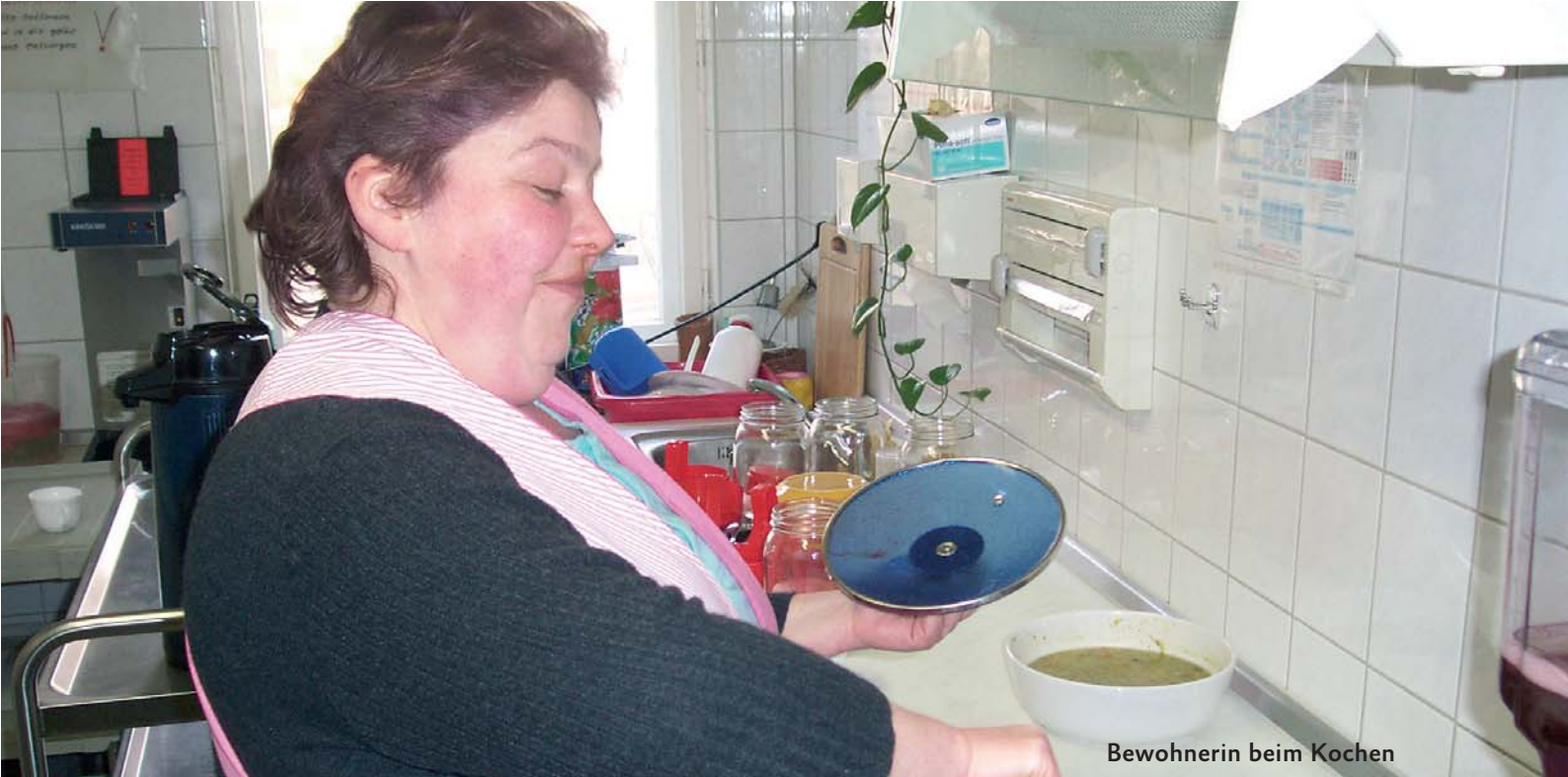
Bewohnerin beim Kochen