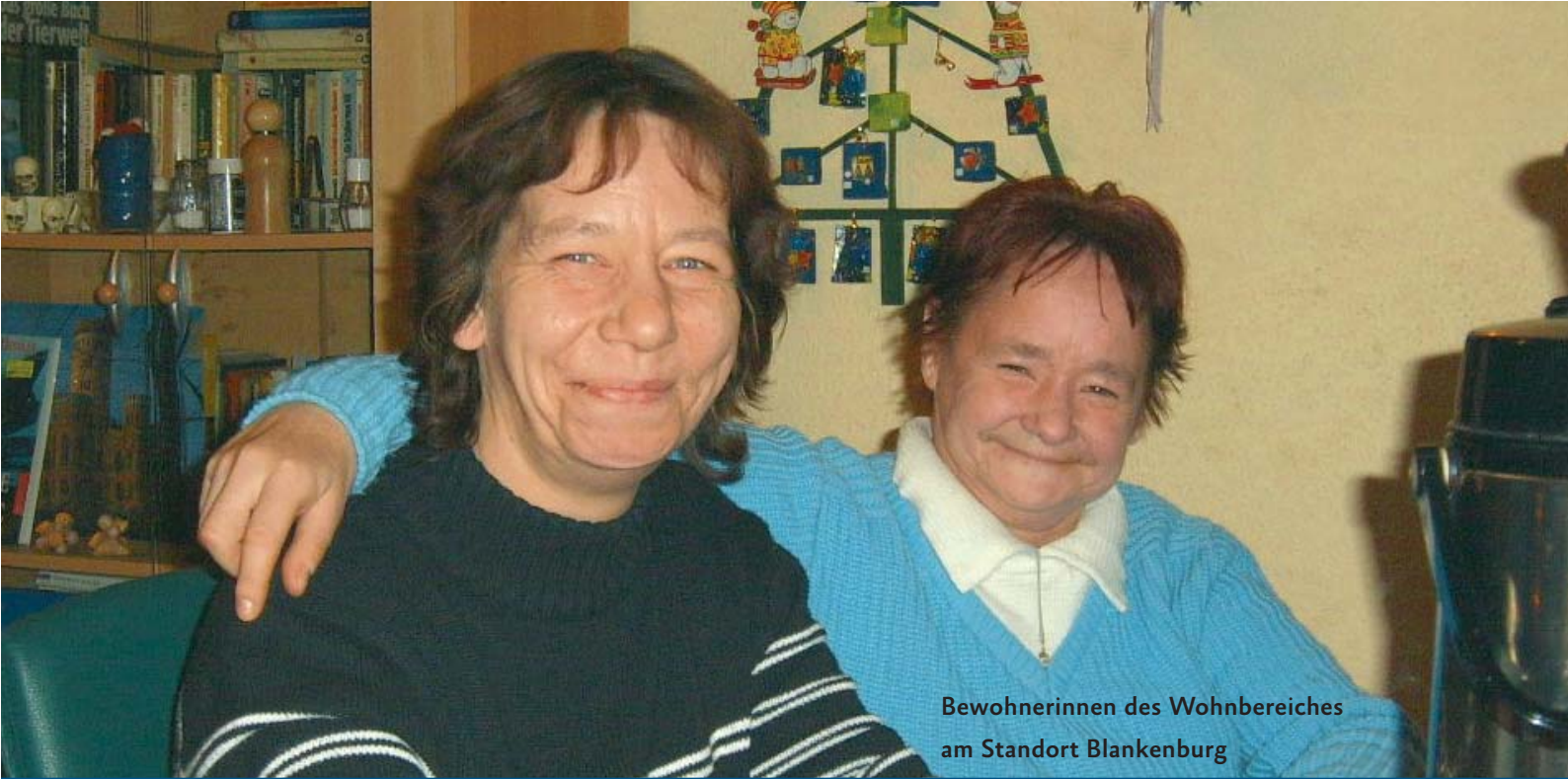
Bewohnerinnen des Wohnbereiches am Standort Blankenburg