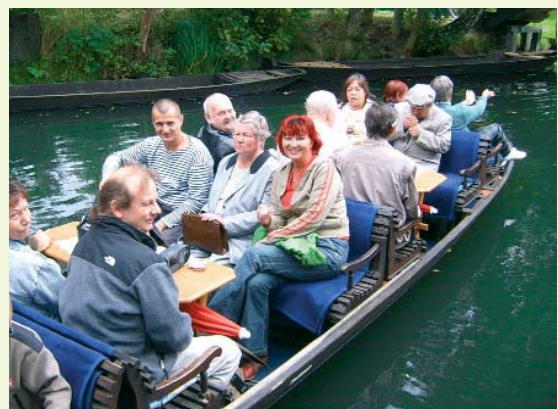
Ausflug in den Spreewald

W ir haben ein Qualitätsmanagementsystem aufgebaut, welches uns dabei unterstützt, die Qualität unserer Dienstleistung zu erhalten und sie beständig weiterzuentwickeln. Hierfür werden Arbeitsabläufe neu überdacht, aufgeschrieben und im Alltag umgesetzt. Unser Qualitätsmanagementhandbuch enthält diese gemeinsam erarbeiteten Qualitätsstandards und Vordrucke, die uns in unserer Arbeit unterstützen.