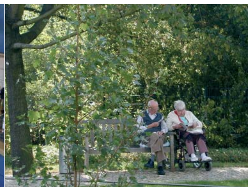
Garten am Haus Kaysersberg