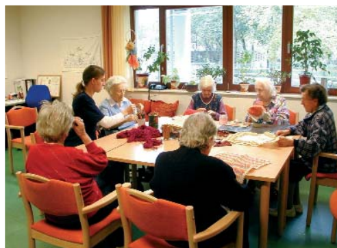
L.: ergotherapeutisches Angebot