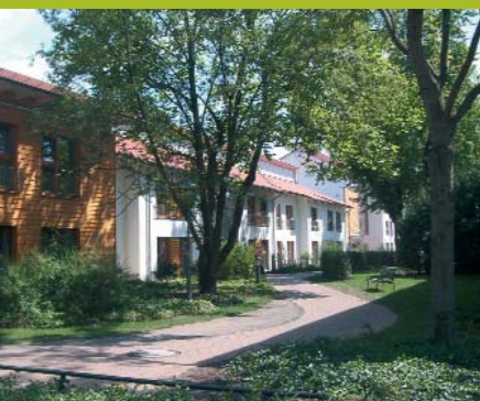
Haus Helene Schweitzer-Breslau