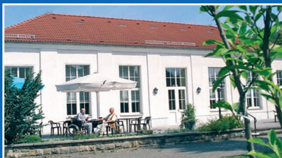
1 Standort Blankenburg