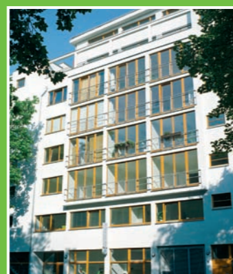
2 Standort Kollwitzstraße