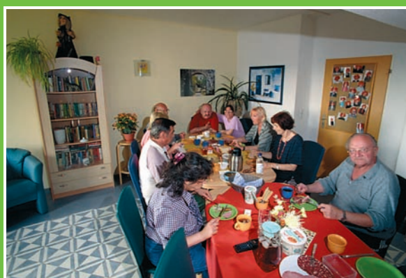
1 Standort Blankenburg